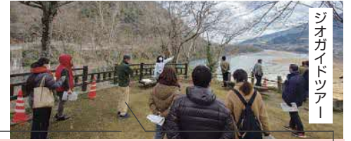
ジオガイドツアー